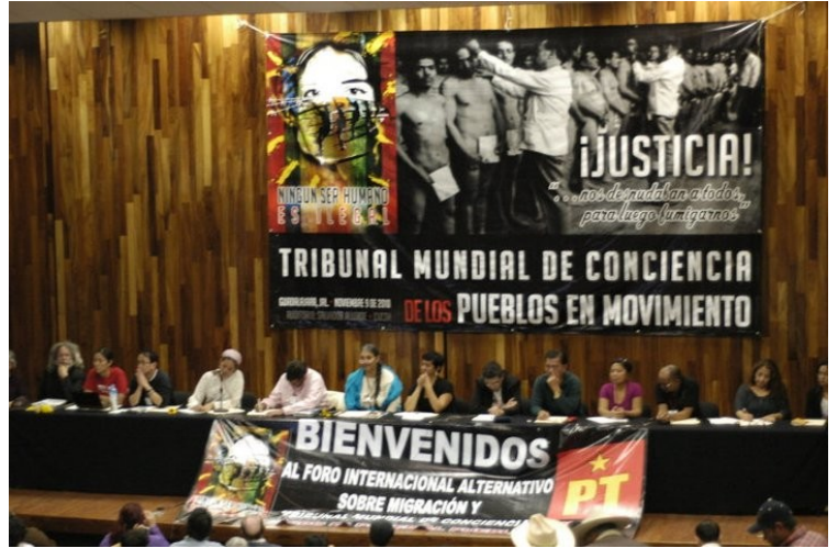
Opening day of the 3rd International Assembly of Migrants and Refugees (IAMR) In Mexico City