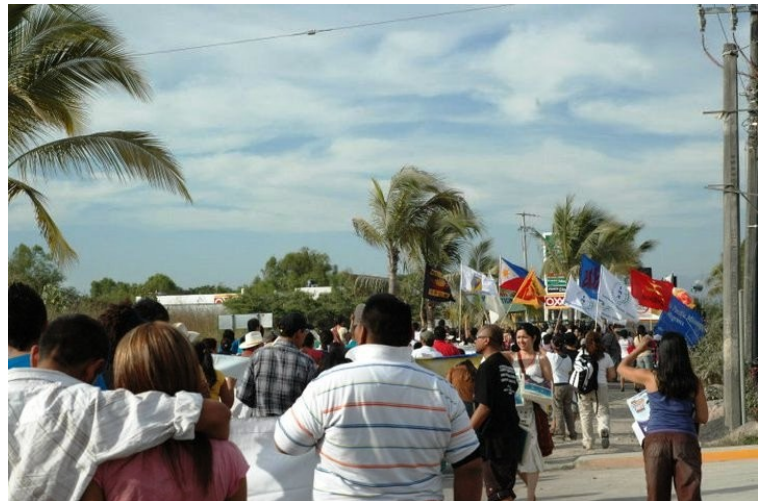
March of migrants and their supporters from IAMR conference site to the site of Global Forum on Migration and Development (GFMD) They were later stopped by the Police to prevent them from arriving at the GFMD conference site.